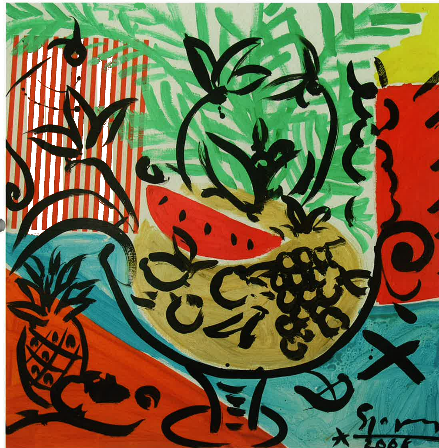
Nature morte au melon

Un artiste allemand à Saint-Tropez. L'association peut surprendre. C'est pourtant toute la joie de vivre d'un hédoniste méditerranéen qui se dégage des toiles de Stefan Szczesny : les formes simples, les couleurs vives, les jeux de lumière qui jouent avec le corps féminin. Saint-Tropez pour Szczesny, c'est "cette volupté dans l'air, cette lumière franche, cette douceur de vivre". C'est la ville où Matisse élabore une de ses premières toiles fauves, intitulée "Luxe, calme et volupté". Ce titre tiré d'un poème de Baudelaire, Invitation au voyage, pourrait englober toute l'œuvre de Szczesny. Matisse est avec Picasso un des maîtres de l'artiste allemand, initiateur du mouvement des "Nouveaux fauves", qui a connu son apogée dans les années 1980. L'invitation à l'amitié et au plaisir qui se dégage des toiles de Szczesny est aussi pour l'artiste une philosophie de son rapport à l'art et de son art de vivre. Szczesny a ses propres galeries, appelées "Factory", conçues à la manière d'Andy Warhol comme des lieux de partage et d'échange, où l'artiste, et non le galeriste, est au premier plan. Pour Sczesny, l'art ne se laisse