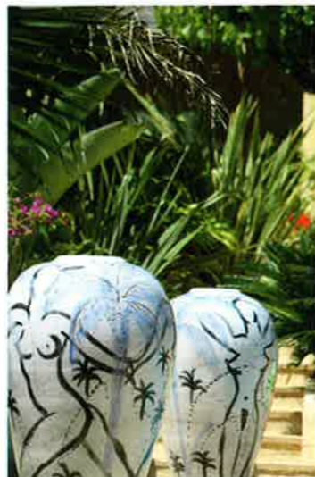
Œuvres sur supports en verre et céramique