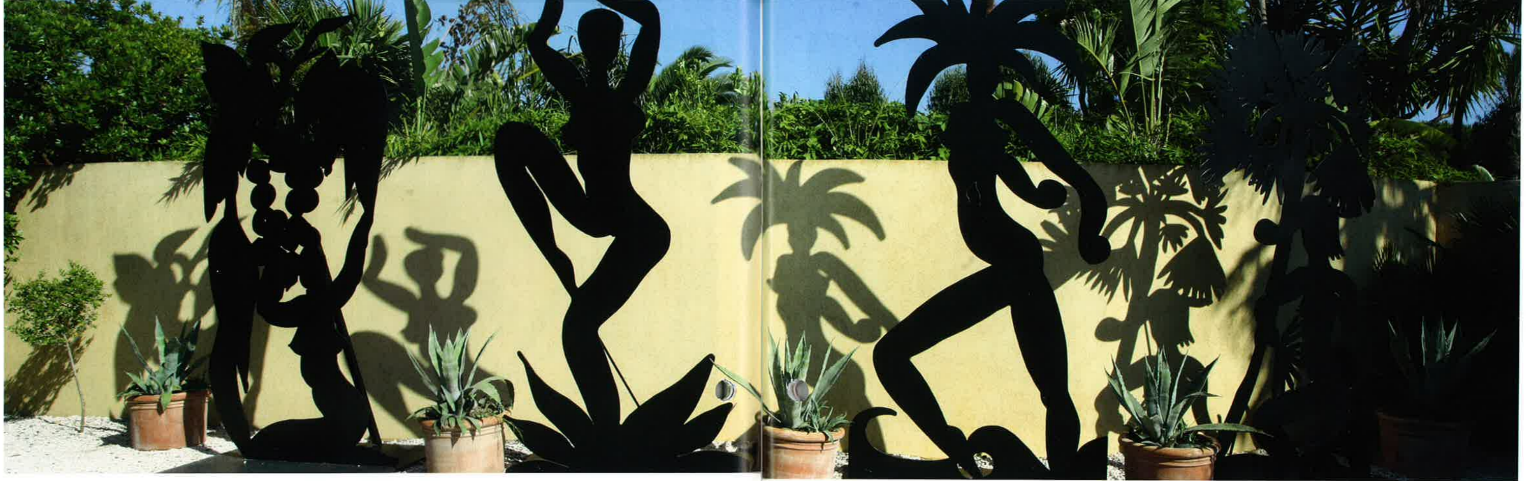
Sculptures d'ombre à Saint-Tropez

pas enfermer, il est dans les jardins, dans les maisons, dans les objets du quotidien, sur les terrasses des cafés et des hôtels. Il doit faire partie de l'environnement immédiat, presque comme des créations de la nature, auprès desquelles on vit, on parle, on s'aime. Saint-Tropez est aussi pour Szczesny un lieu dans le monde entier se rencontre, "la Côte d'Azur est un lieu extrêmement international, où se côtoient énormément de nationalités, de cultures, de langues", confie l'artiste, qui se définit lui-même comme un "européen passionné". "J'ai